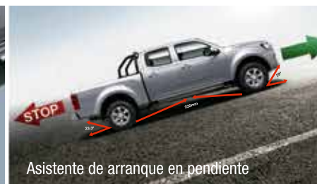
Asistente de arranque en pendiente