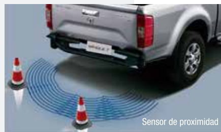
Sensor de proximidad