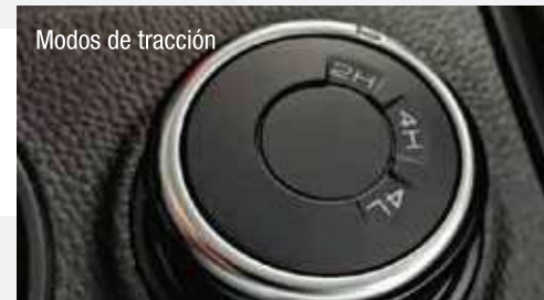
Modos de tracción