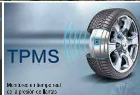
Monitoreo en tiempo real de la presión de llantas