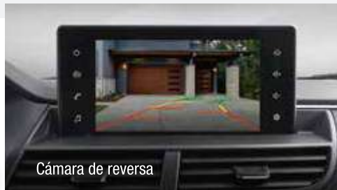
Cámara de reversa