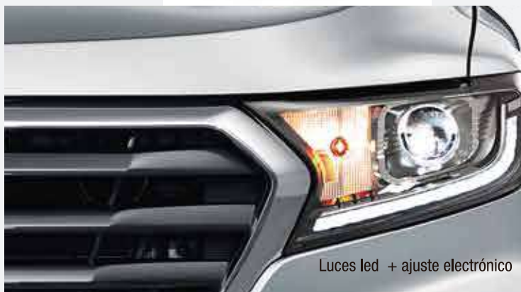
Luces led + ajuste electrónico