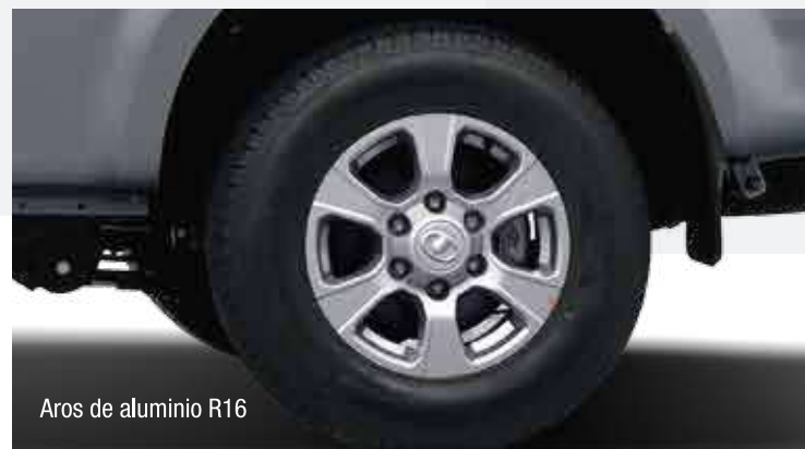
Aros de aluminio R16