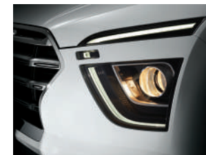
Luces de posición LED