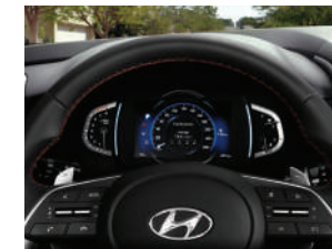
Volante de cuero multifunción