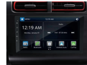
Pantalla táctil de 10" con Apple car/Android Auto