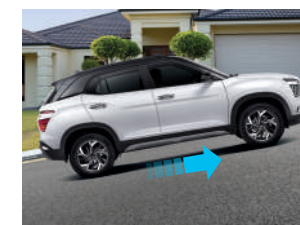
Asistente de arranque en pendiente (HAC)