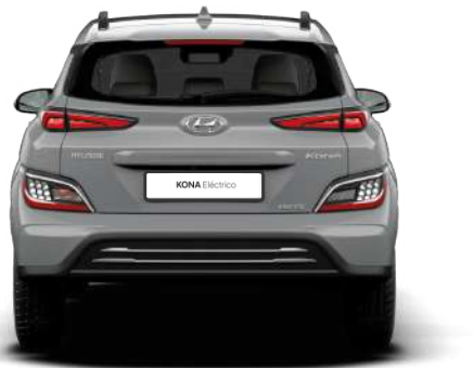
Ancho general 1,997 Banda de rodadura* 1,721