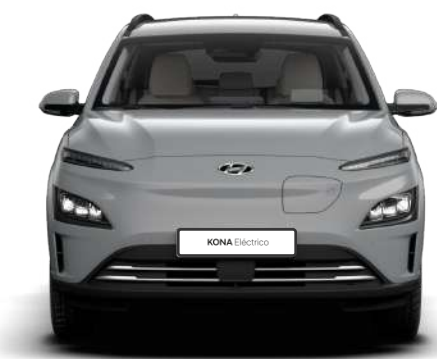
Ancho general 1,997 Banda de rodadura* 1,721