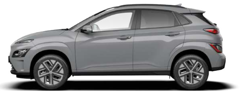
Longitud general 5,253 Distancia entre ejes 3,273