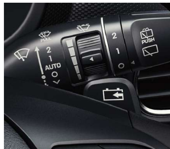
Paleta de cambio para frenos regenerativos ajustables