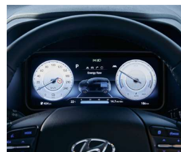
Tablero de instrumentos con pantalla LCD 10,25" Control crucero