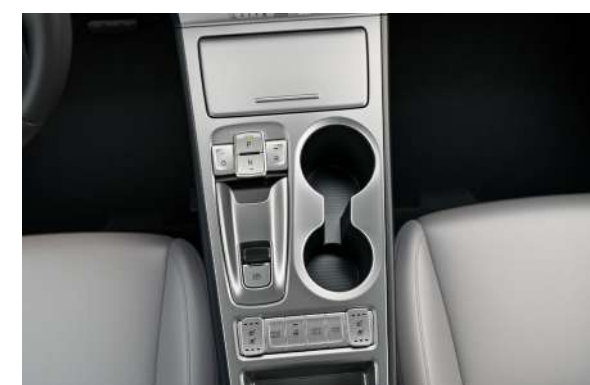
Transmisión automática (Shift-by-Wire)* Freno de estacionamiento eléctrico con función Autohold