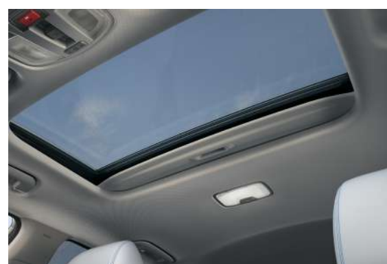
Techo corredizo con seguridad One Touch