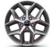
Rines de 16" de aluminio LX