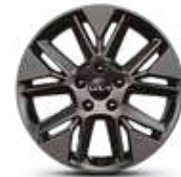
Rines de 17" de aluminio EX