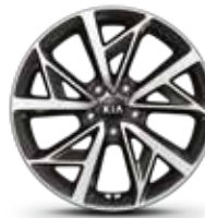
Rines de aluminio de 18"