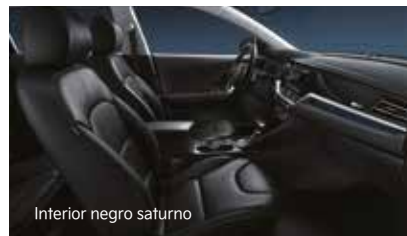
Interior negro saturno