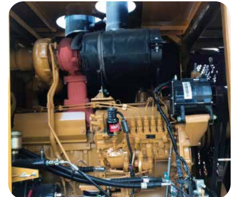
Equipado con motor Shangchai Diseño CAT, tecnología avanzada, excelente durabilidad, eficiencia. Motores Weichai y Cummins son opcionales.