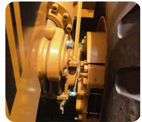
Frenos de fácil mantenimiento y durabilidad