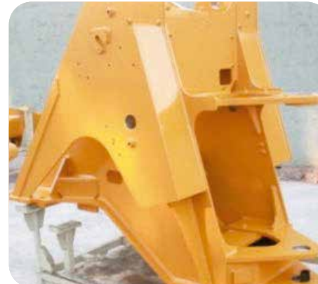
Bastidor articulado diseñado con tecnología europea, durable y de 4 placas rígidas, lo cual mejora la resistencia torsional en un 56%