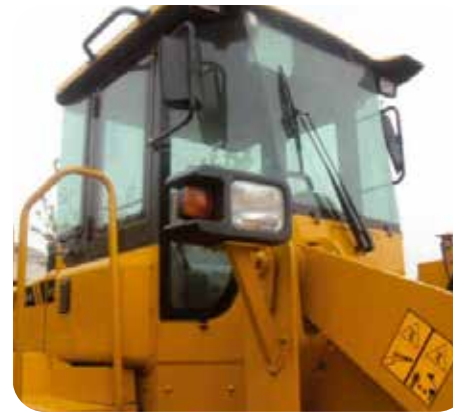
Vidrio plano y vista en cabina de 360° que ofrece la mejor visualización y seguridad para el operador. Con A/C y silla graduable por peso