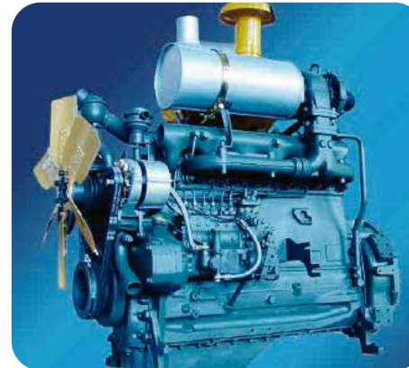
Equipado con motor WEICHA-DEUTZ WP6G125E22, tecnología avanzada, excelente durabilidad, eficiencia de poder y economía