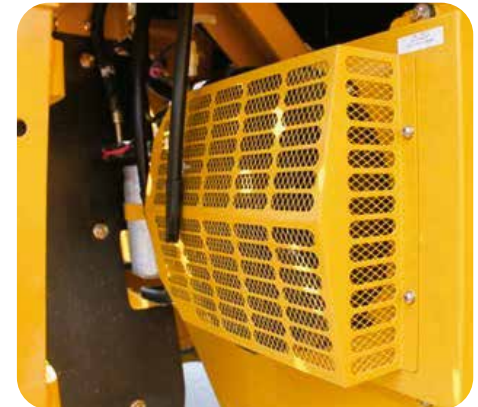
Sistema de A/C con alto desempeño. La radiación independiente activa el condensador para un mejor efecto de enfriado