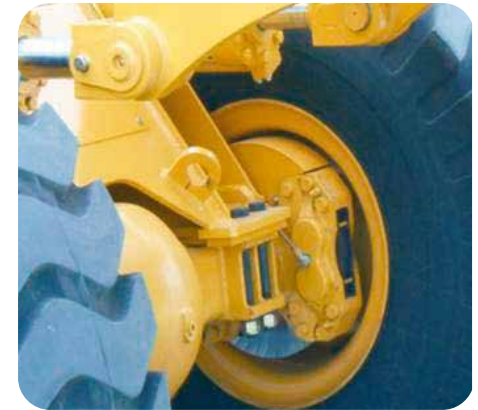
Protectores de eje delantero ayudan a prevenir la entrada de polvo o piedras en los calipers cuando se está trabajando: Fácil mantenimiento, sistema de frenos