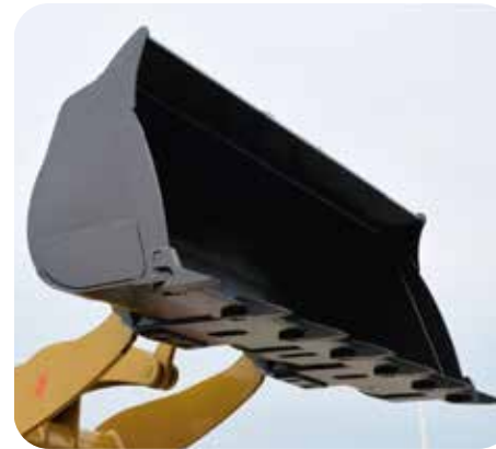
Las cuchillas del balde están hechas de un avanzado material con un desempeño superior antidesgaste