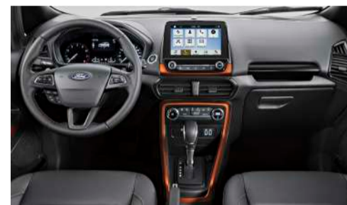
Interior EcoSport Storm Sync 3® com tela de 8" e Transmissão Automática