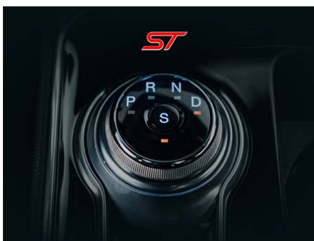
Transmissão Automática de 8 velocidades com E-Shift