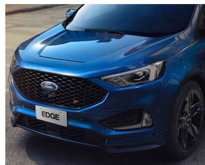
Nova grade personalizada com logo ST e rodas de 21"