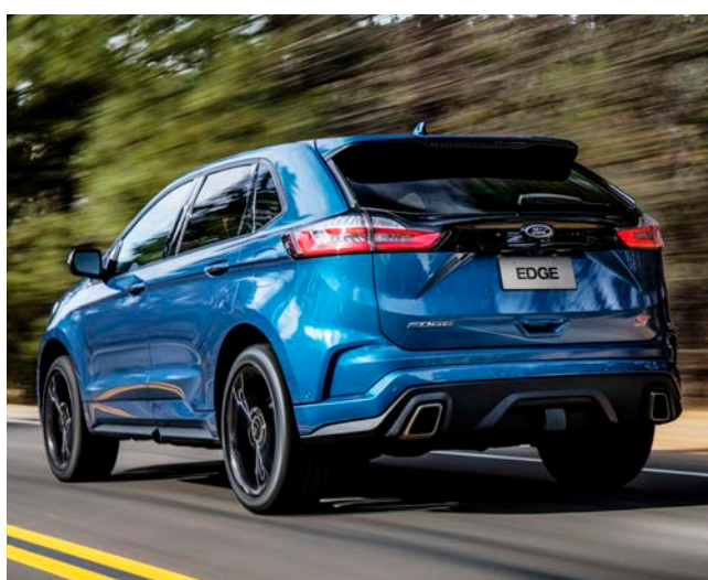
Um esportivo de alta performance