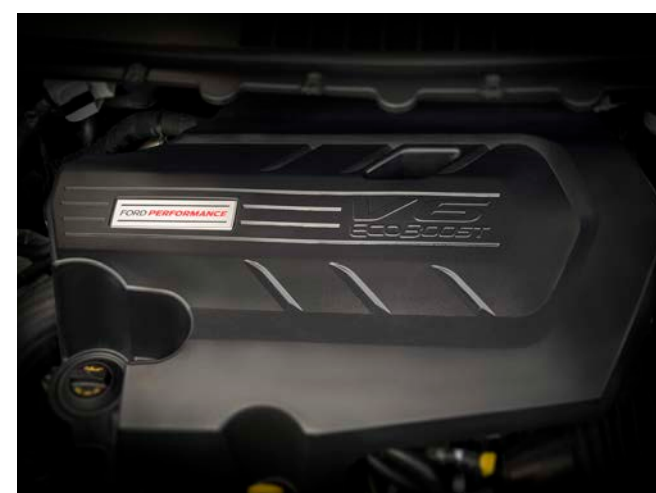
Novo Motor 2.7 Biturbo EcoBoost® de 335 cv