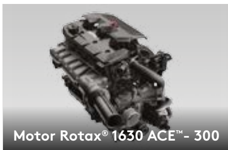
Motor Rotax® 1630 ACE™ - 300

The Rotax® 1630 ACE - 300 é o mais potente motor Rotax® jamais produzido, entregando alta eficiência e um poder de aceleração impressionante.