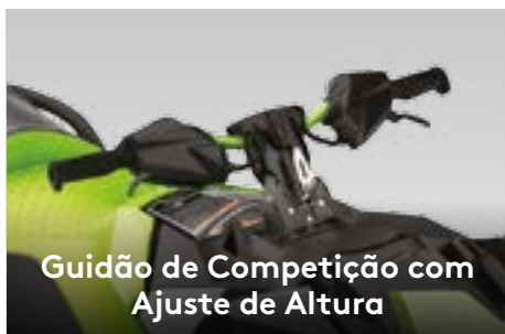
Guidão de Competição com Ajuste de Altura

Um assento com perfil estreito e bolsões profundos para os joelhos permitem ao piloto se encaixar com maior naturalidade e usar as pernas como apoio na pilotagem.