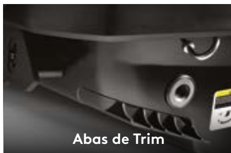
Abas de Trim

Um guidão com ajuste telescópico que otimiza a experiência para os mais variados tamanhos de pilotos.