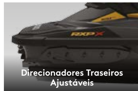
Direcionadores Traseiros Ajustáveis

Limitam a elevação da proa e melhoram o desempenho sob quaisquer condições da água.