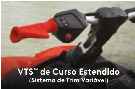
VTS™ de Curso Estendido (Sistema de Trim Variável)

Proporciona muito mais estabilidade e confiança em diferentes posições de pilotagem, tornando mais fácil a execução de manobras.