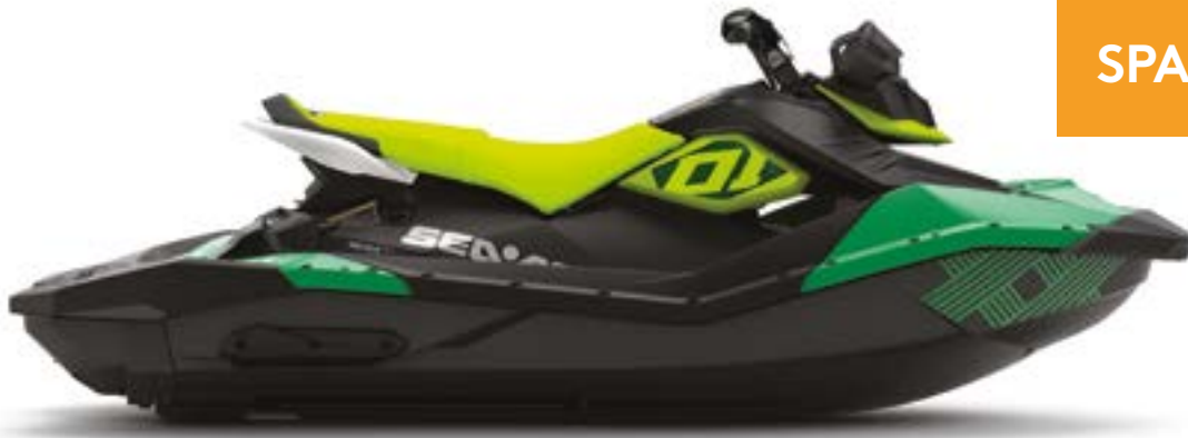
SPARK TRIXX 3UP