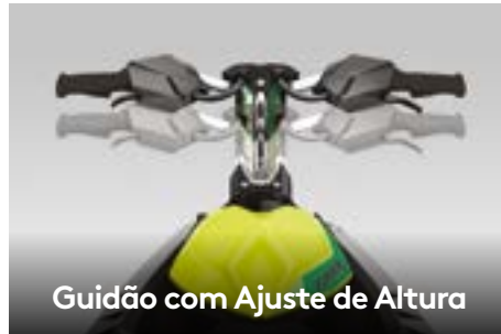
Guidão com Ajuste de Altura

Sistema de som portátil Bluetooth ® de alta qualidade, à prova d'água e com 50W de potência.