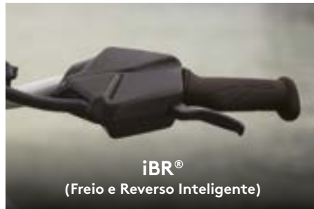
iBR® (Freio e Reverso Inteligente)

Oferece o dobro de ajustes de um VTS™ convencional, facilitando a execução de manobras elaboradas.