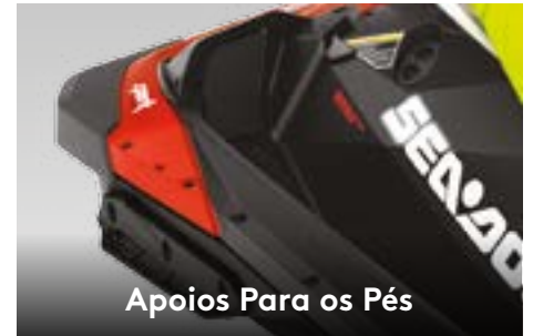
Apoios Para os Pés

Um guidão com ajuste telescópico que otimiza a experiência para os mais variados tamanhos de pilotos.