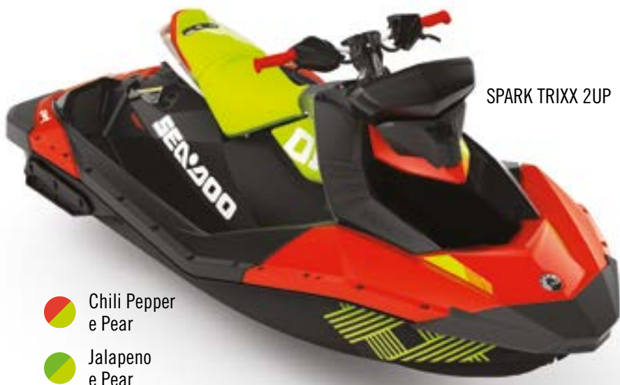
SPARK TRIXX 2UP