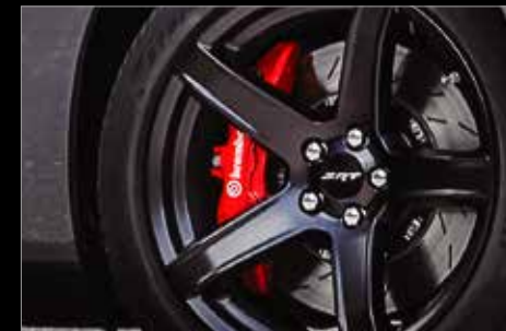
FRENOS BREMBO® DE ALTO RENDIMIENTO CON CALIPERS DE 6 PISTONES EN COLOR ROJO