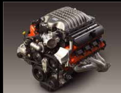
MOTOR HEMI® HELLCAT 6.2L V8 SUPERCARGADO CON 707 C.F. (VERSIÓN HELLCAT)