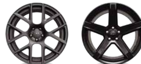
R/T DAYTONA DE ALUMINIO FORJADO DE 20"