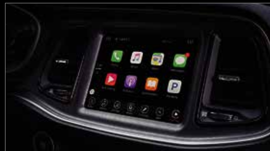
SISTEMA UCONNECT® 8.4" CON APPLE CARPLAY® Y GOOGLE ANDROID AUTO®