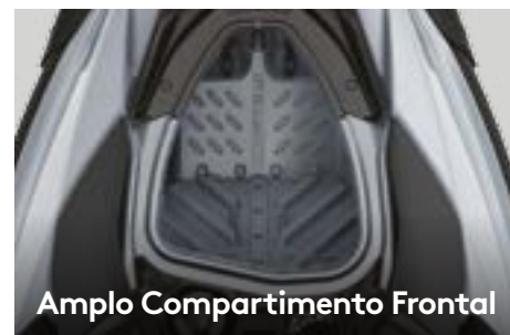
Amplio Compartimento Frontal

Projetado especificamente para atender às necessidades de navegadores recreativos, o material Polytec GEN 2 é altamente robusto e resistente a riscos e reduz o peso total do veículo melhorando a eficiência.