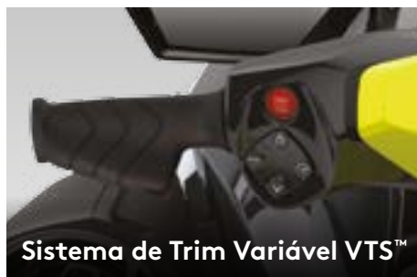
Sistema de Trim Variável VTS™

Este potente motor vem de fábrica com um supercharger e intercooler externo. É otimizado para funcionar com combustível comum, para maior economia