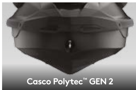
Casco Polytec™ GEN 2

Sistema exclusivo de fixação rápida em uma ampla plataforma de mergulho que permite a fácil instalação de acessórios.