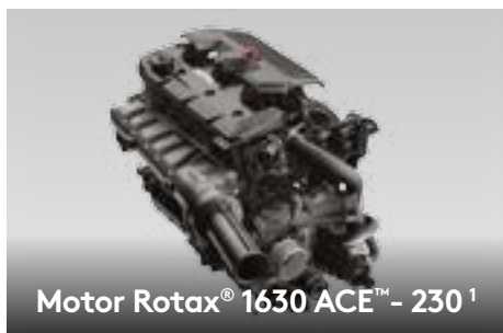
Motor Rotax® 1630 ACE™ - 230 1

Este potente motor vem de fábrica com um supercharger e intercooler externo. É otimizado para funcionar com combustível comum, para maior economia