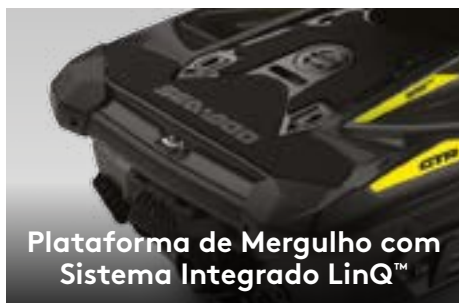
Plataforma de Mergulho com Sistema Integrado LinQ™

O primeiro sistema de áudio Bluetooth® original de fábrica, verdadeiramente à prova de água.