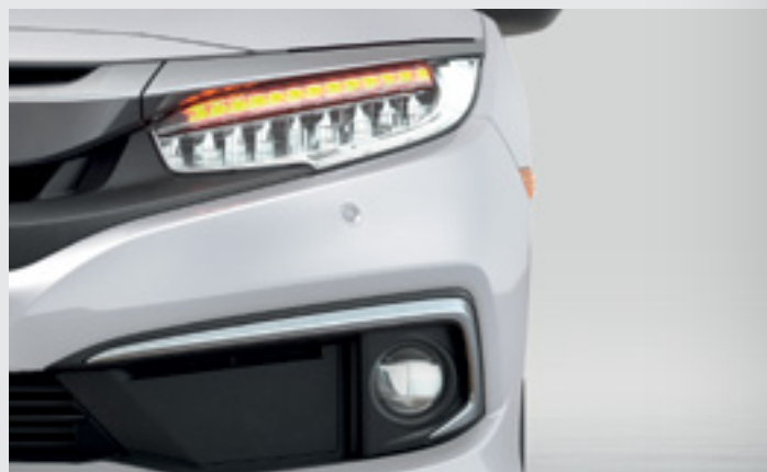
Faróis Full LED.