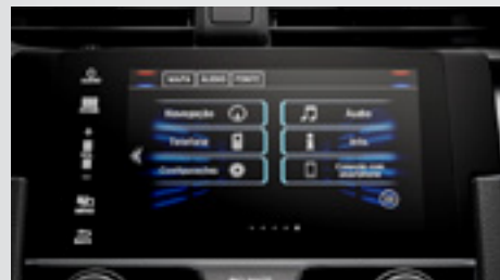
Multimídia de 7" com Navegador, Interface para Smartphone.

O volante multifuncional , em todas as versões, possui