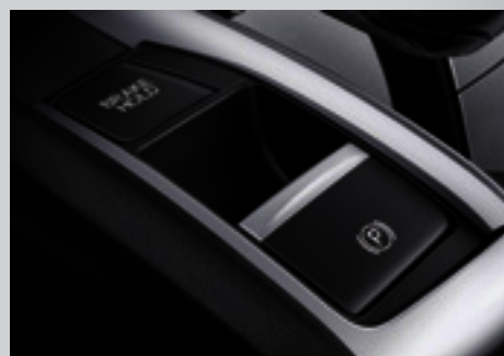
Freio de Estacionamento Eletrônico (EPB) com Função Brake Hold.