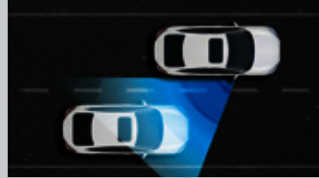
Exclusivo Sistema Honda LaneWatch™.

O conjunto de suspensões é um grande diferencial para quem procura performance e estabilidade ao dirigir. Além das Suspensões Dianteiras MacPherson com barras estabilizadoras, o Honda Civic vem de série com Suspensão Traseira Multi-Link também com barras estabilizadoras que garantem conforto diferenciado e dirigibilidade excepcional. Tem mais: para dar a partida nas versões EXL e Touring , basta pisar no freio, pressionar o botão de partida do motor (START/STOP) e seguir viagem, sem a necessidade do uso de chaves para ignição.