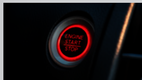
Botão de Partida do Motor (Start/Stop).