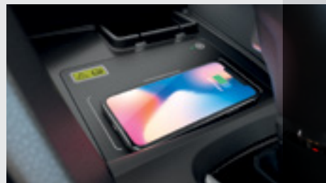
Carregamento por Indução (wireless).