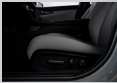
Banco do motorista com ajuste lombar e regulagens elétricas.