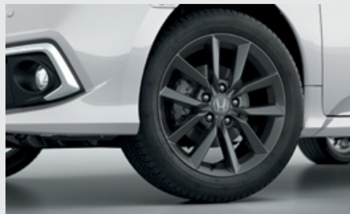
Rodas de Liga Leve.

A versão Touring , que entrega o máximo da experiência Civic , possui teto solar e faróis FULL LED .