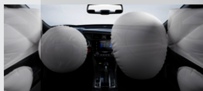
6 Airbags (2 frontais, 2 laterais e 2 de cortina).

Projetado para o seu conforto, o Honda Civic possui câmbio de transmissão automática do tipo CVT (Continuamente Variável) e, a partir da versão Sport , Paddle Shift de 7 velocidades que combinados proporcionam uma condução suave, com respostas mais precisas e aceleração linear.