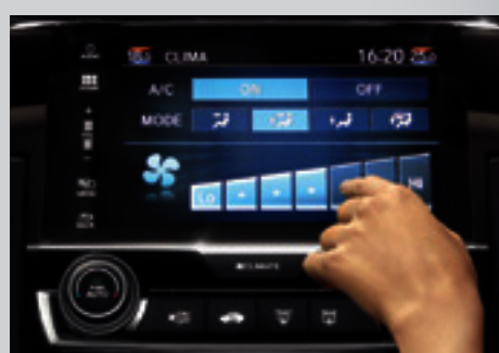
Ar-Condicionado Digital com Função Dual Zone.