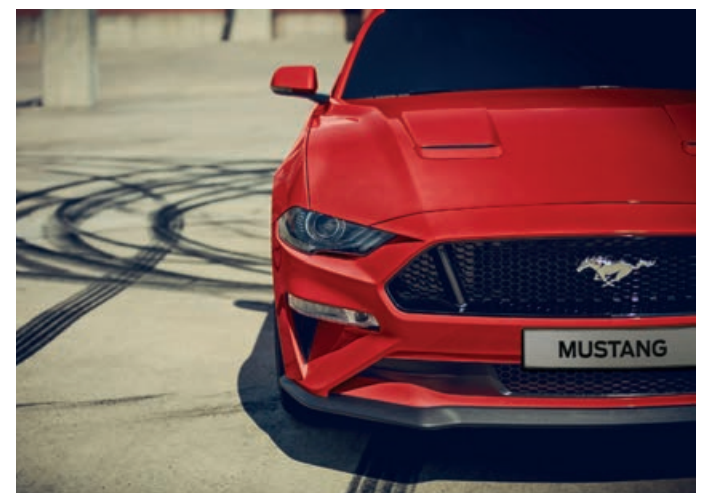
Line Lock e Suspensão MagneRide®