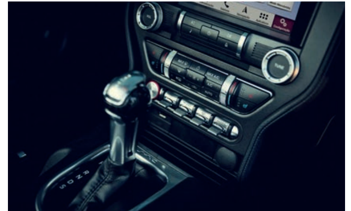
Transmissão automática de 10 velocidades