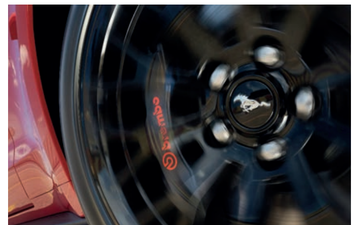
Freios de alta performance BREMBO®