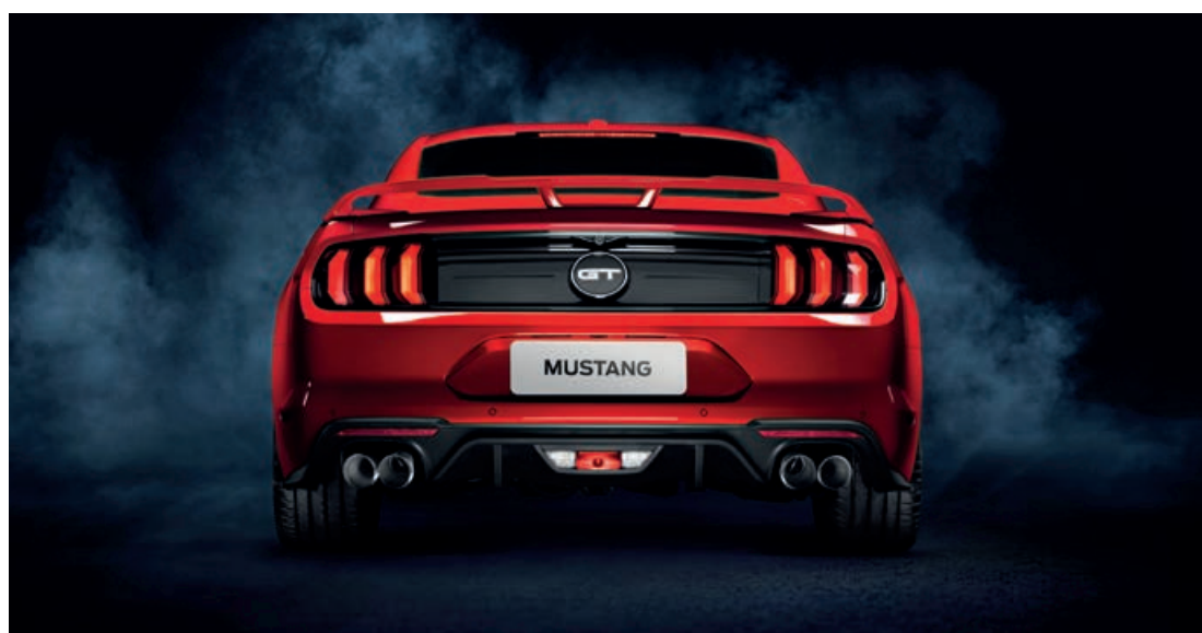
Traseira esportiva com iluminação icônica com três barras de LED.