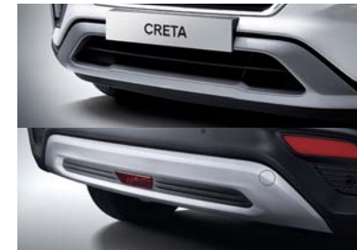
Placa protectora delantera y trasera