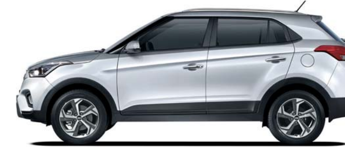
Distancia entre ejes 2,590 Longitud general 4,280