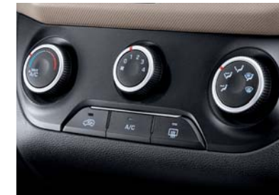
Aire acondicionado manual