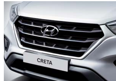
Parrilla del radiador