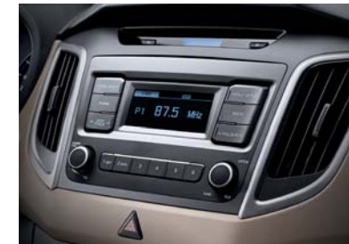
Reproductor básico AM / FM y MP3