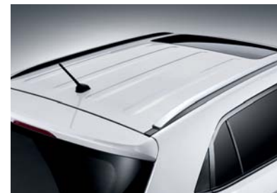
Rack en el techo