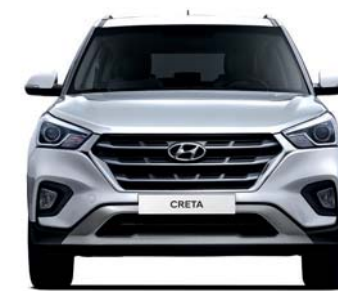
Banda de rodadura* 1,544.6 Altura general 1,780