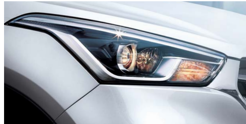
Proyección de faros Faros antiniebla con luces diurnas LED (DRL)