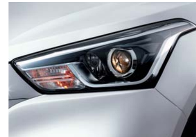
Focos delanteros de proyección