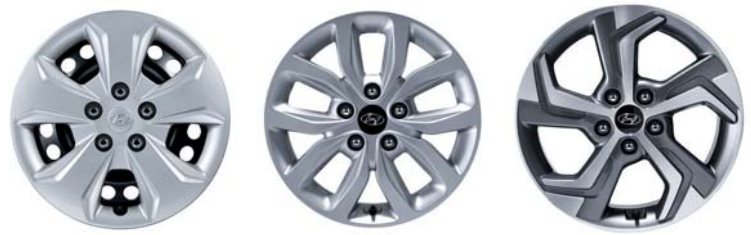
Llantas de acero de 16" Llantas de aleación de 16" Llantas de aleación de 17"