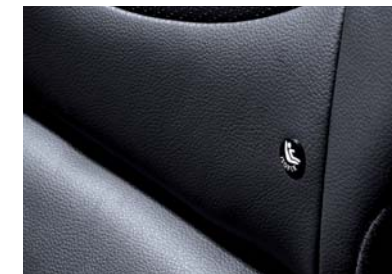
Ancla de asiento para niños