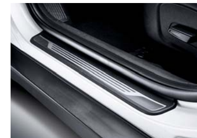
Placas protectoras de las puertas