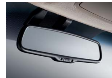
Espejo cromo eléctrico (ECM)