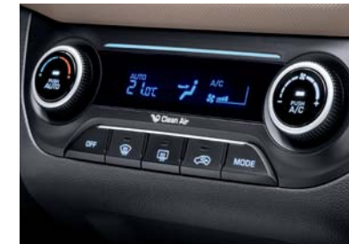
Aire acondicionado automático total