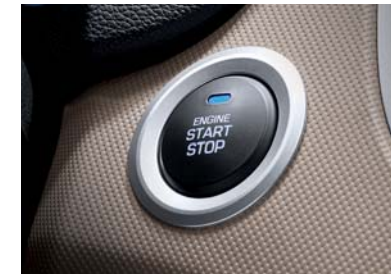
Botón de encendido