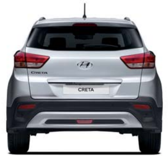
Banda de rodadura* 1,558