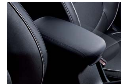
Consola central deslizante