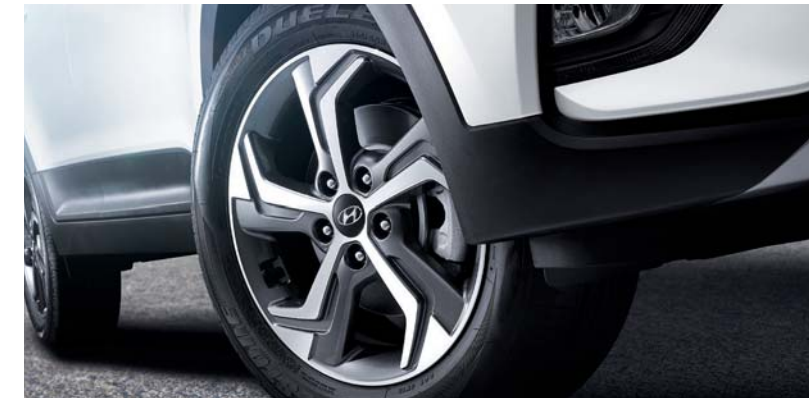
Llantas de aleación de 17" Faros traseros combinados