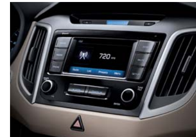
Reproductor AM / FM y MP3 premium