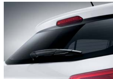
Limpiador en la puerta posterior