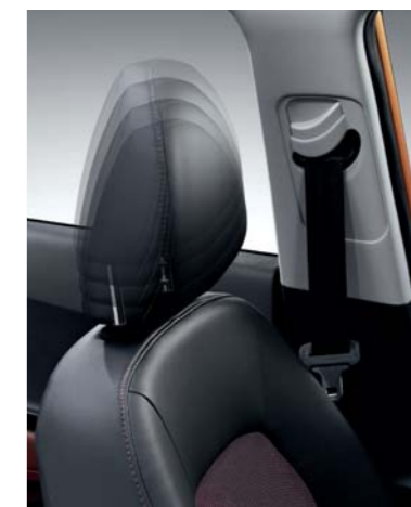
• Apoyacabezas delanteros ajustables