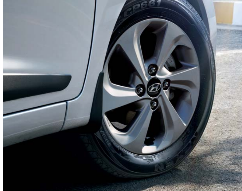
01. Llantas de aleación elegantes