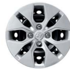
Funda de llanta de acero de 14"