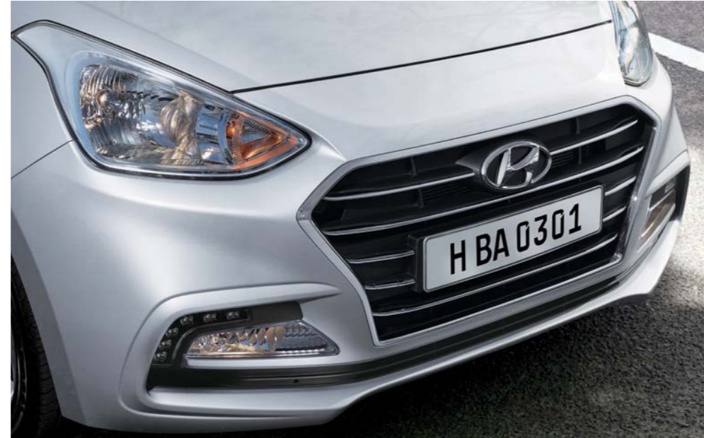
02. Faros envolventes