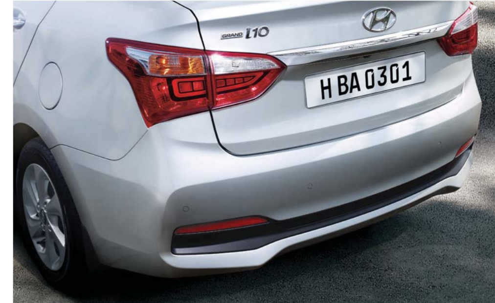
04. Empezando por la parte trasera

01. Los detalles secundarios y las elegantes llantas de aleación de aluminio proyectan sofisticación y deportividad.