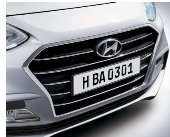
• Nueva rejilla en cascada