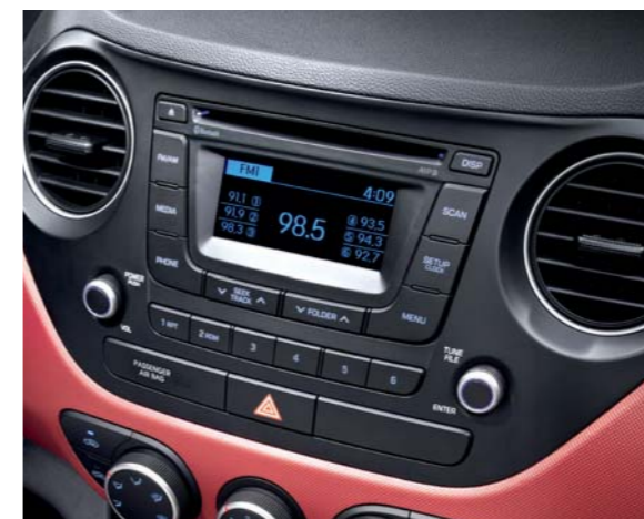
• Sistema de audio