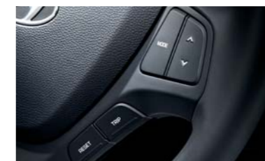
• Sistema de audio con control remoto • Controles eléctricos para las ventanillas