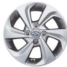
Llantas de aleación de 14 pulgadas