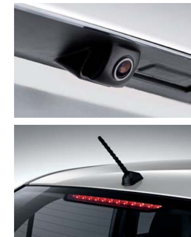
• Sistema de monitoreo con visualización trasera • Antena de techo