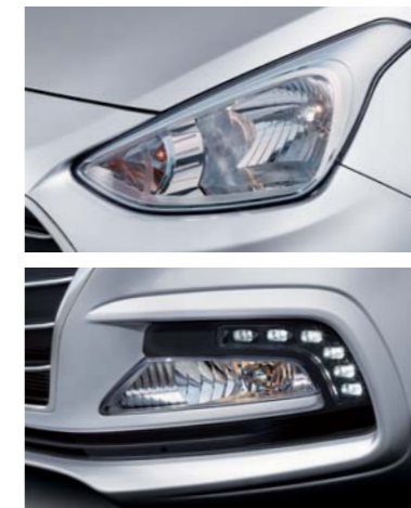
• Faros delanteros • Luces LED de conducción diurna