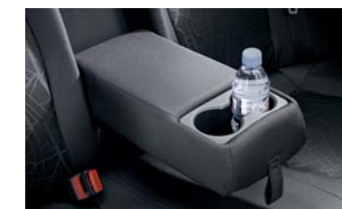
• Asiento posterior con portavasos en el apoyabrazos • Ajuste del asiento del conductor