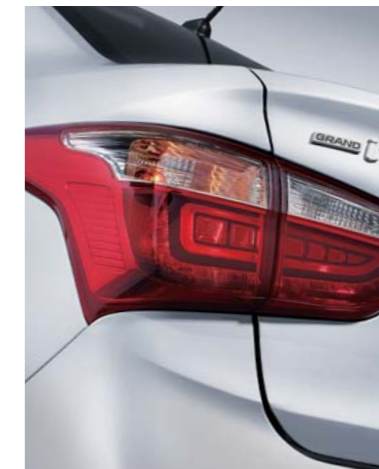
• Luces traseras combinadas