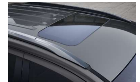
Teto solar elétrico