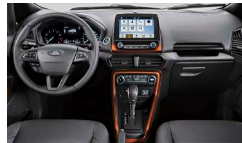
Interior EcoSport Storm Sync 3® com tela de 8" e Nova Transmissão Automática