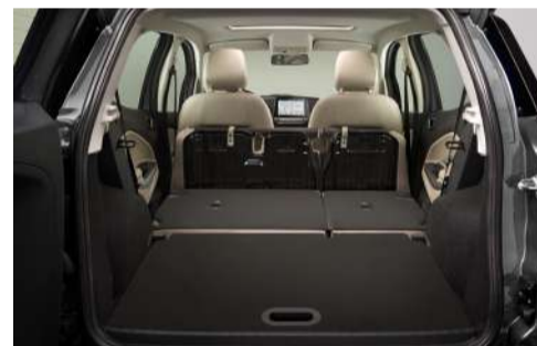
Assolho inteligente do porta-malas