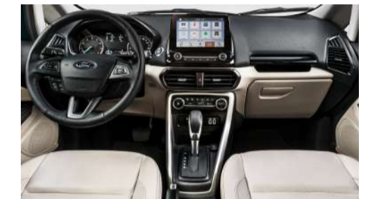
Interior EcoSport Titanium Sync 3® com tela de 8" e Nova Transmissão Automática