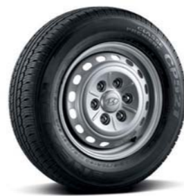
Acero de 16"