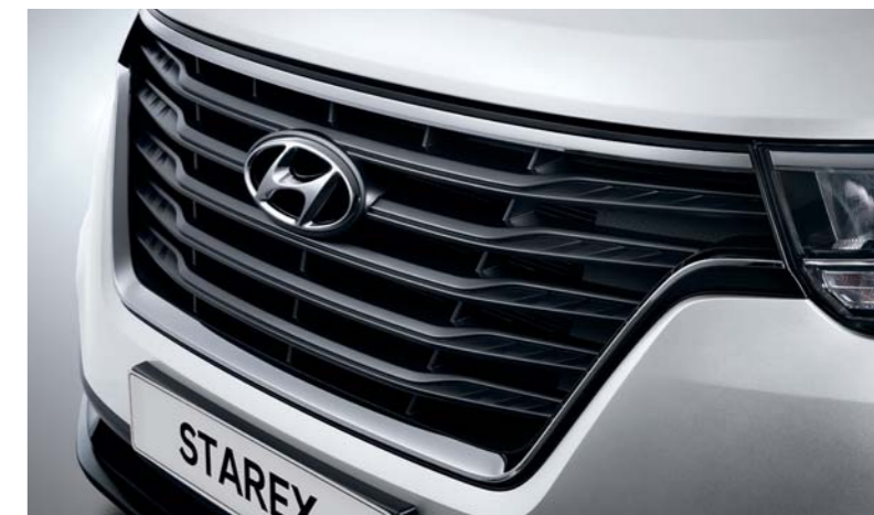
Parrilla robusta, distintivo Hyundai.