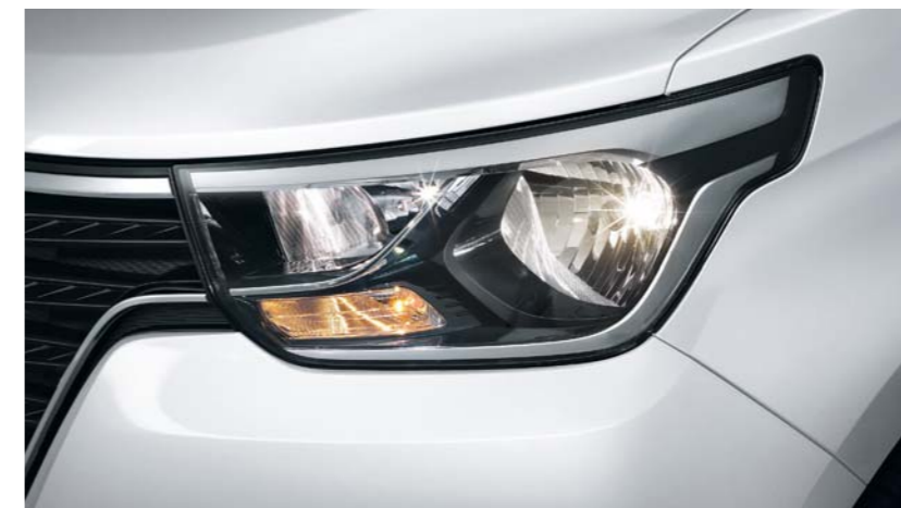
Cuenta con atractivos faros frontales transparentes.

La nueva Hyundai Starex es un mundo hacia nuevos viajes y oportunidades de negocio.