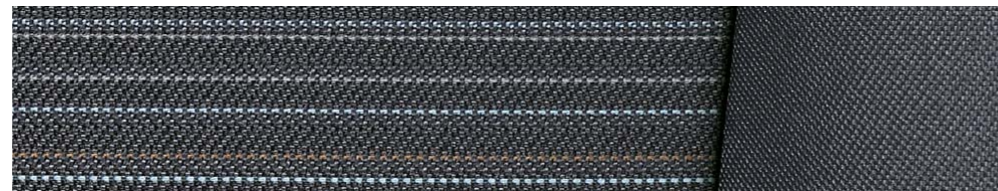
Gris / Tela