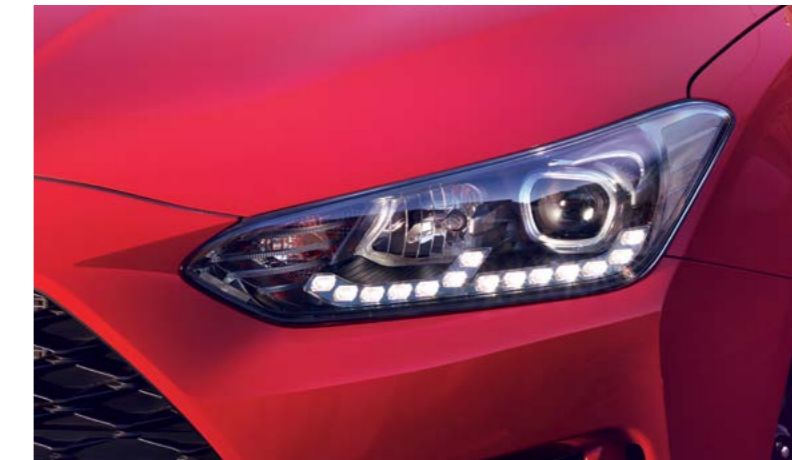
Faros delanteros LED

Dicen que el interior es lo que cuenta. Pero si quieres adelantarte al resto, necesitas un automóvil que absolutamente llame la atención. No sólo por el interior sino también por el exterior. Nos puedes dar las gracias después.