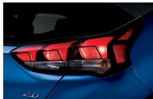
Luces combinadas traseras (tipo lámpara)