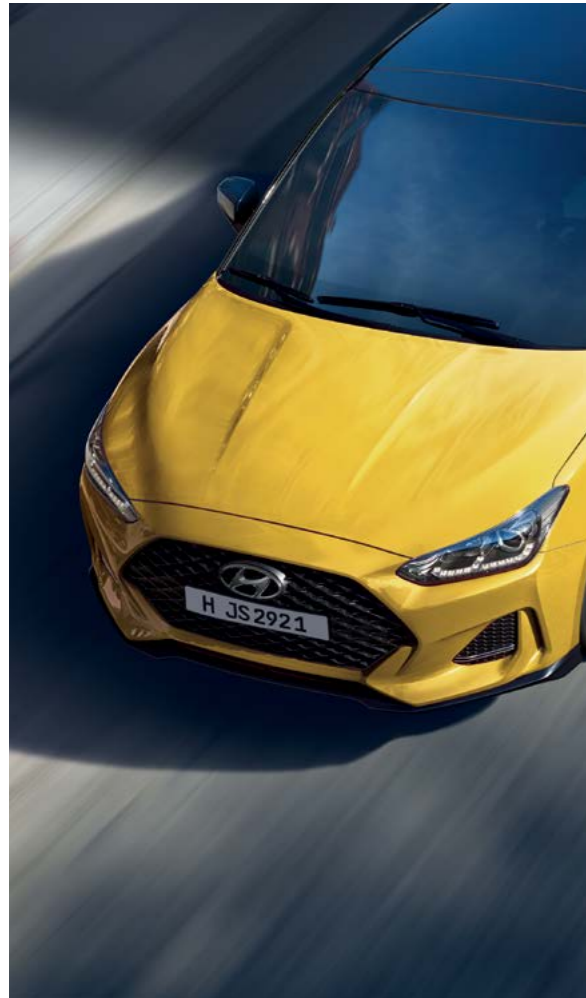
Color de carrocería rayo Thunderbolt