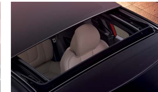
Techo corredizo tipo amplio