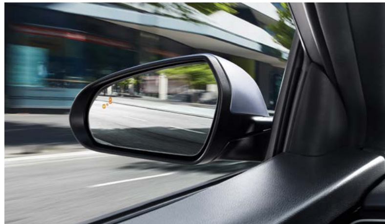
Alerta de punto ciego (BCW)

Este automóvil no solo captará todas las miradas, sino que además te cuida. Equipado con Alerta de Punto Ciego (BCW) y Alerta de Cruce de Tráfico Trasero (RCCW), siempre te mantendrá sano y salvo en tu propio ámbito motorizado.