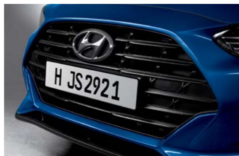
Rejilla en cascada (tipo barra horizontal, motor 2.0 solamente)