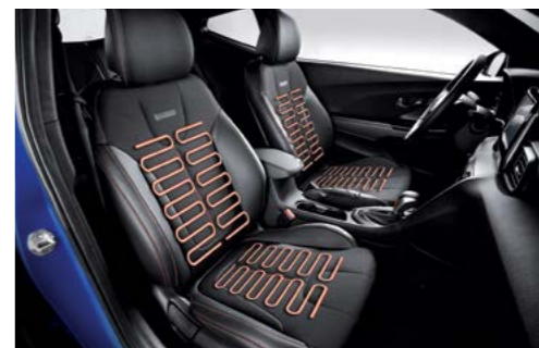
Asientos con calefacción