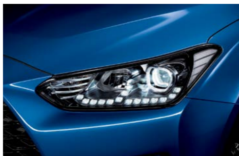
Faros delanteros LED con LED y DRL