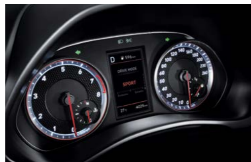
Tablero de supervisión de 4.2" (Turbo 1.6)