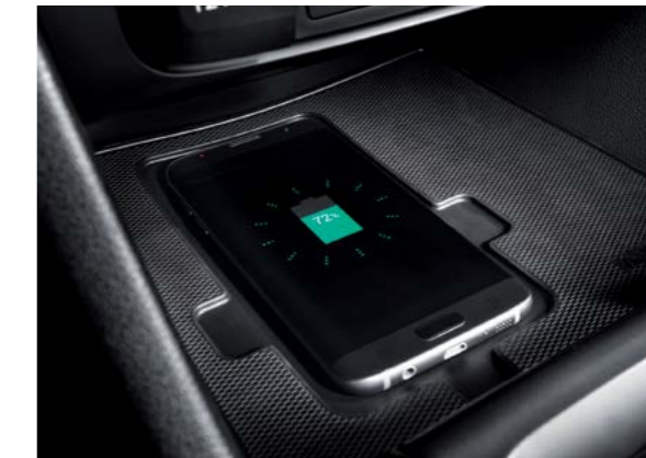
Sistema de recarga inalámbrico para teléfonos inteligentes