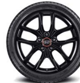
Llantas de aleación de 18"