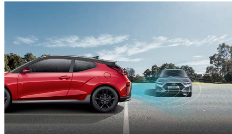
Alerta de cruce de tráfico trasero (RCCW)