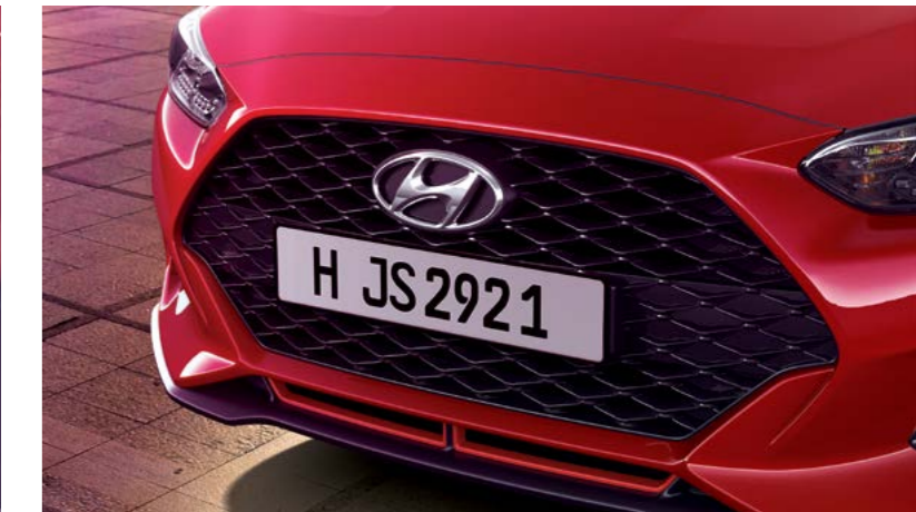
Parrilla del radiador (para Turbo 1.6 solamente)