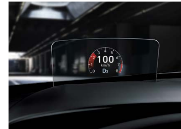
Pantalla de proyección superior integrada

Internet no se detiene solo porque estás en la carretera. Este es el motivo por el cual el Veloster totalmente nuevo viene con todos los detalles: repleto de tecnología de punta para mantenerte satisfecho y conectado cuando manejas.