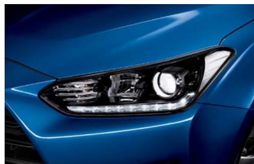
Faros delanteros de proyección con LED y DRL