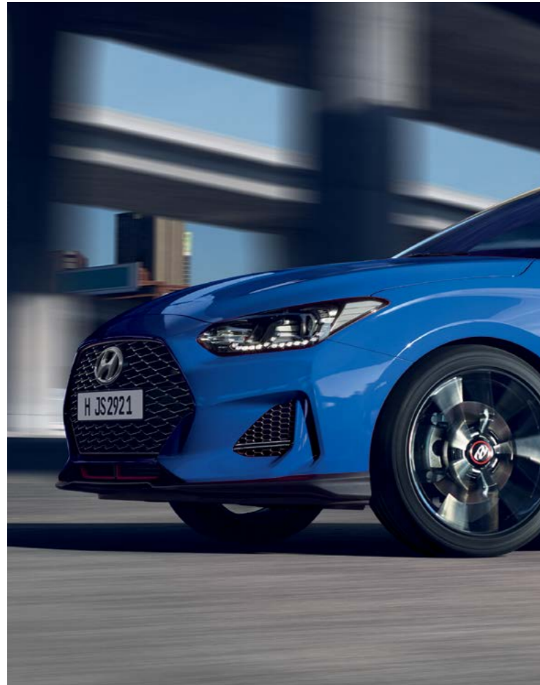
Color de carrocería eclipse de cobalto