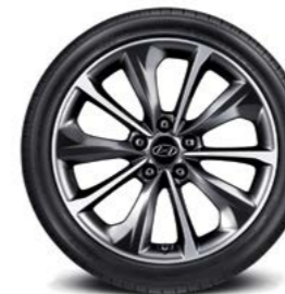
Llantas de aleación de 18"