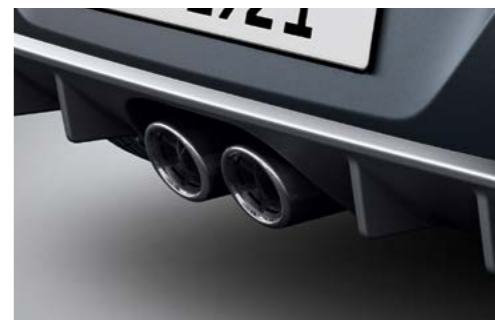
Silenciador de doble extremo centrado