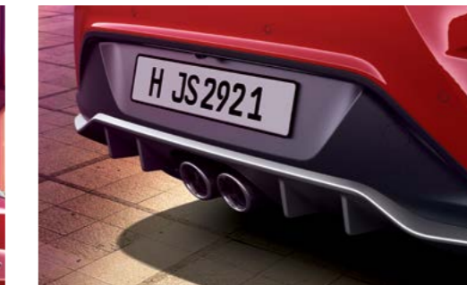
Silenciador de doble extremo centrado (para Turbo 1.6 solamente)