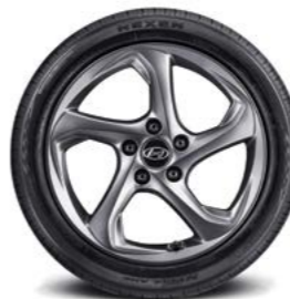
Llantas de aleación de 17"