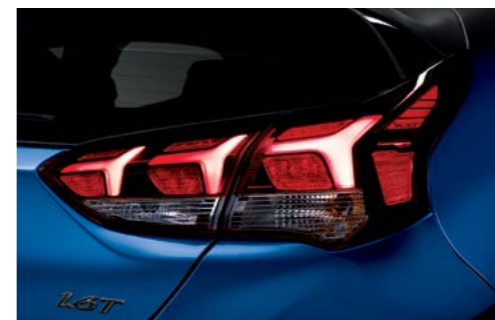
Faros traseros LED