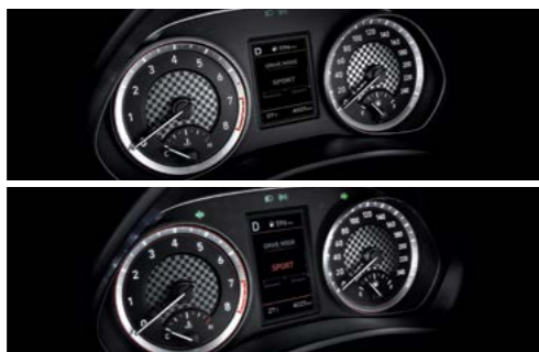
Tablero de 3.5"/Tablero de supervisión de 4.2" (MPI 2.0)