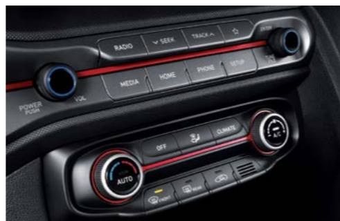
Aire acondicionado totalmente automático con desempañado automático