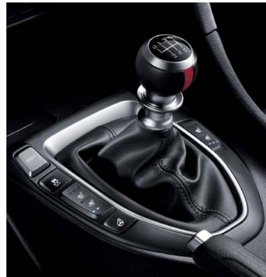
Transmisión manual de 6 velocidades (para Turbo 1.6)

Impresionante. Potente. Alucinante. Las palabras ni siquiera se acercan a lo que realmente se siente al conducir el nuevo Veloster. La agilidad única al doblar en cada curva. El gratificante sonido deportivo cuando se pisa el pedal del acelerador.