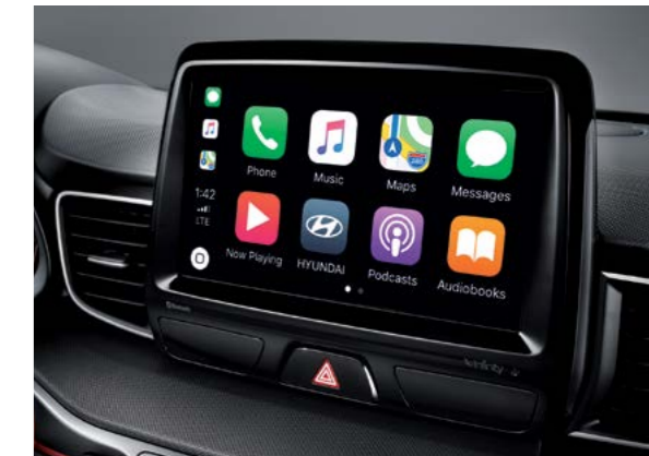
Conectividad para teléfonos inteligentes (Apple CarPlay, Android Auto)