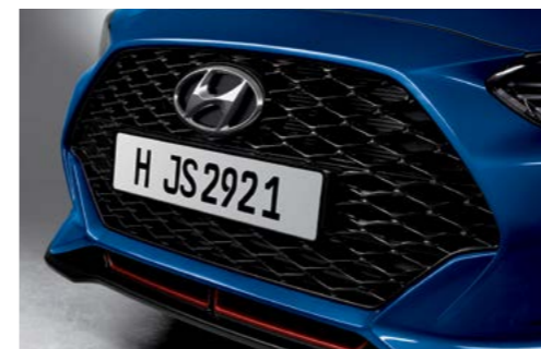
Rejilla en cascada (tipo malla) y ala de paragolpes delantero