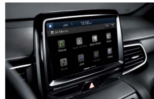
Pantalla táctil de 8"