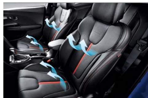
Asientos con ventilación