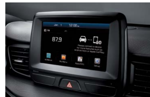
Pantalla táctil de 7"