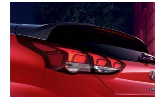
Alerón trasero/Faros traseros LED (para Turbo 1.6)