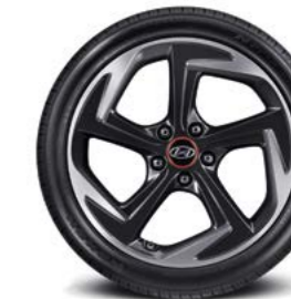
Llantas de aleación de 18"