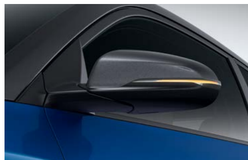
Espejos exteriores con indicador LED