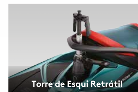
Torre de Esqui Retrátil

Cinco ajustes de aceleração pré-estabelecidos que permitem uma arrancada suave e a manutenção de um ritmo constante.