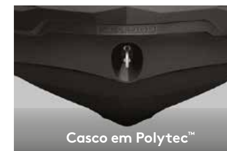
Casco em Polytec™

Permite que o condutor encontre facilmente o ajuste ideal de nivelamento de acordo com as condições da água.