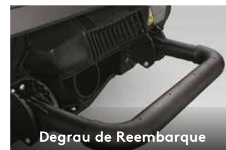
Degrau de Reembarque

Proporciona fácil transporte do wakeboard. 1