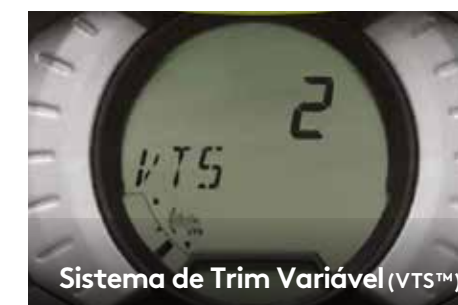
Sistema de Trim Variável (VTS™)

Torna o reembarque na água mais fácil e rápido.