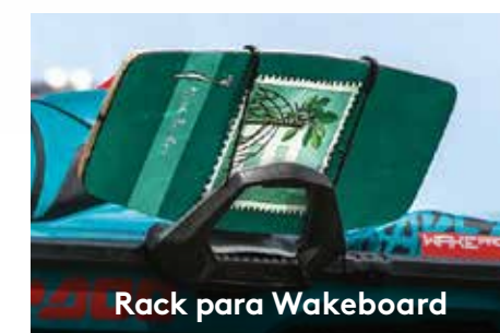
Rack para Wakeboard

Proporciona um ponto ideal de reboque e se retrai quando não estiver em uso. Possui manoplas de apoio para o vigia e espaço de armazenagem para a corda.